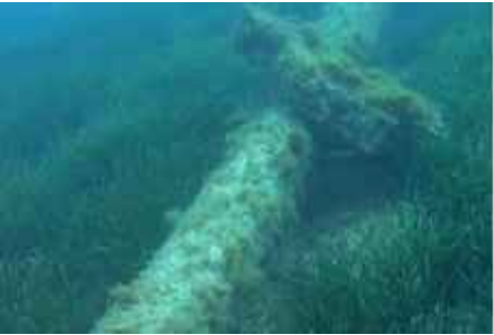
Imagen 10. Lastre a retirar (1/22)