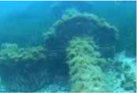
Imagen 8. Lastre inicial del tramo (cota -11 m)