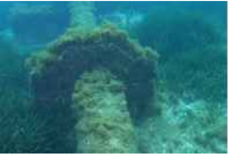
Imagen 9. Lastre final del tramo (cota -12 m)